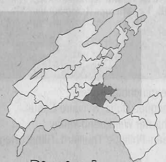
District de Lavaux-Oron

Défrichés et peuplés dès avant le XIII e siècle, Savigny et le Martinet ne furent érigés en commune particulière qu'en 1823. Jusqu'alors, ils relevaient de l'administration de l'ancienne grande communauté de Lutry. Les armoiries ont été créées en 1923. Leurs émaux rappellent les armes de Lutry, les sapins et les monts symbolisent le Jorat et les forêts dont cette commune est entourée.