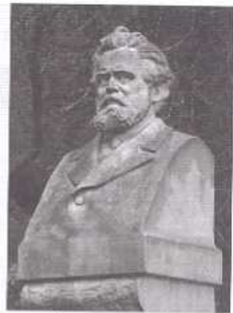
Buste du poète Giosuè Alessandri Michele Carducci dans la ville de Pietrasanta.

Et comme il est d'une curiosité insatiable, dès qu'il débarque quelque part, il veut tout connaître: l'origine des gens, le pourquoi des toponymes, les particularités de l'habitat. C'est ce qui