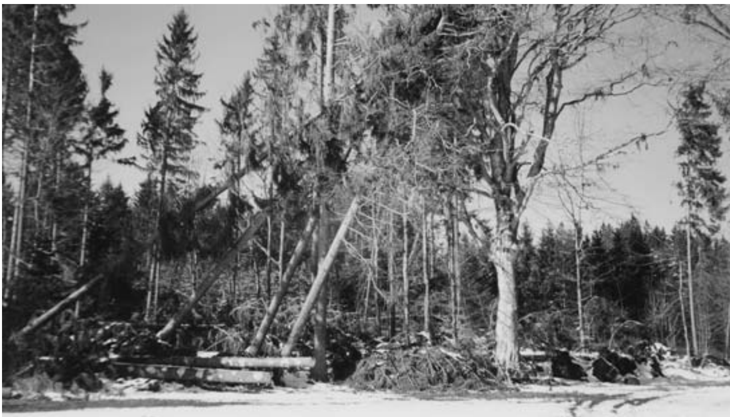
Quand Lothar joue au mikado.