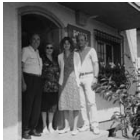
Passation de pouvoirs à la poste de Mollie-Margot, ou quand la poste avait encore un côté humain.

Hier, qu'une poignée de petites mains apprenait à ne pas se mêler les doigts dans les ailes d'un canard. Hier encore, que le canard déployait maladroitement ses