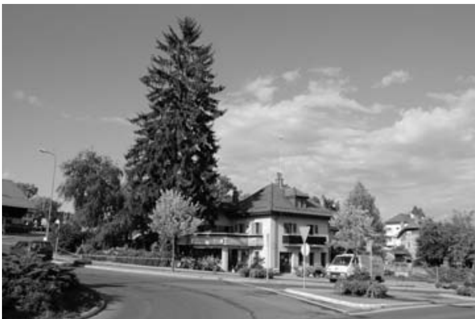
Le 27 août 2004, la foudre modifiait le paysage au cœur du village. Désormais, plus rien ne fait de l'ombre au giratoire.

pages, craintif de se prendre dans la presse des hostiles ou de ceux qui voulaient le cuisiner à leur sauce. Les petites mains se faisaient un sang d'encre pour ce jeune canard qui parfois laissait des plumes sous le plomb des chasseurs embusqués. Heureusement, que ces derniers sont peu nombreux et, de surcroît, tirent parfois à côté. Quelques fois, au lieu de toucher le canard, ils touchent des petites mains, au point de réduire les doigts laborieux à une main de menuisier. Qu'à cela ne tienne, le lendemain, le canard est toujours vivant! Et à force d'envols, le canard devint alors ange. Bien entendu, un canard ne vole pas toujours angéliquement. Parfois il cherche sa route. Il lui arrive aussi de voler bas, sensible aux turbulences, aux courants, aux leurres. Ainsi, de hier en hier il a traversé la décennie, porté par des plumes qui, si plus nombreuses, le porteraient plus haut.