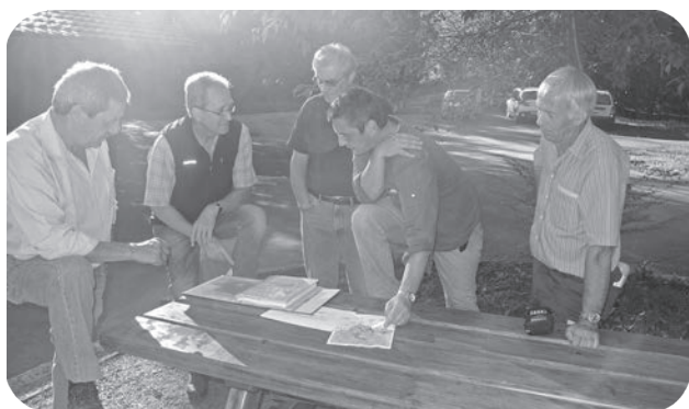
Réunion d'état-major avant le martelage