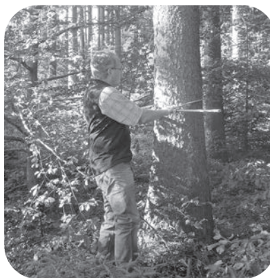
Cubage d'un arbre

le type et la quantité de bois qui va être extrait. Pour terminer, un point rouge est marqué sur le tronc à l'aide d'un spray. Ce signe du condamné indique aux bûcherons les sujets devant être abattus lors de leur passage. Chaque année, on marque le nombre d'arbres nécessaire pour obtenir le volume de bois pouvant être extrait de la forêt. Les différents secteurs dans lesquels il y a des coupes à effectuer font l'objet d'une mise en soumission auprès de plusieurs entreprises forestières. Après l'attribution des