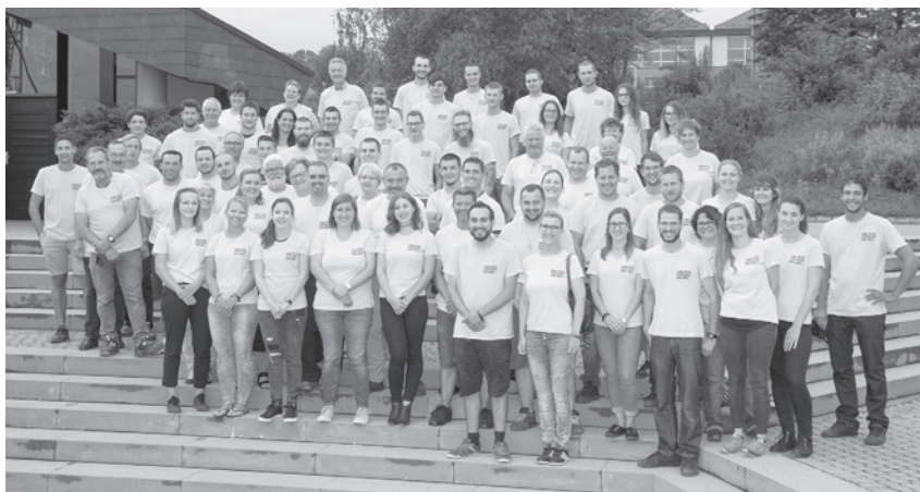
L'équipe sur les escaliers du Forum

En en parlant autour de nous, de fil en aiguille, le 100 e FVJC 2019 à Savigny ne cesse de croître. Composé des membres fédérés venant des 4 coins du canton, des anciens de la Jeunesse de Savigny, ainsi que des amis et connaissances, l'équipe de candidature compte plus de 100 personnes. Pour cette aventure, peu importe d'où viennent les membres, c'est ensemble, sans aucune frontière que le projet se dessine. Ce jubilé sera la fête de toute la «Fédé», jeunes et anciens! du Pied, du Nord, de la Broye, du