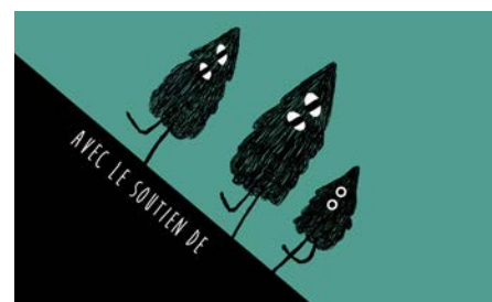
extrait de la bande-annonce animée du festival, réalisée par Marjolaine Perreten

Mais secrètement et je peux le dire à présent, mon animation préférée, même si elle était hors concours, a été celle de l'introduction du Festival du film d'animation de Savigny. Trois ludiques petits sapins dévalant les pentes du Jorat. Une animation évoquant l'emblème de notre commune, tout en intelligence et en finesse, comme l'initiatrice de ce Festival. Encore bravo Marjolaine! – C.W.Y.