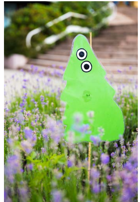
Les petits sapins ornaient tout le village. Merci à l'équipe déco!