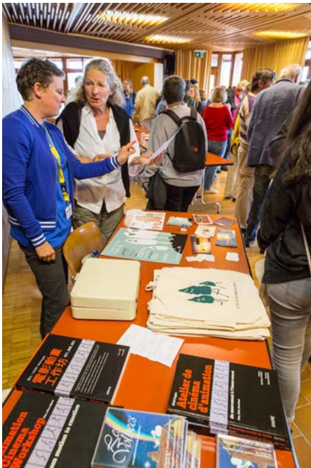
la boutique de l'Apéro

Le Savignolan | édition spéciale | Septembre 2017