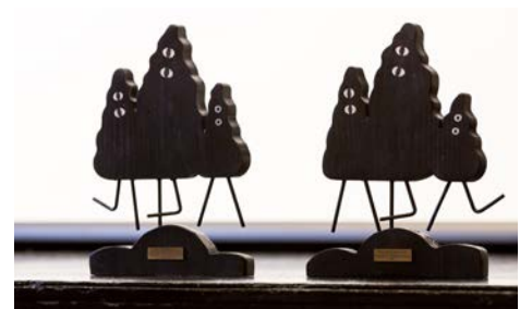
Les trophées en bois ont été réalisés par Jean-Charles De Groot

BOTTLE, Kirsten Lepore, USA INSTINCT, Frederic Siegel, CH PAUTINKA, Natalia Chernysheva, RU VENT DE FÊTE, Marjolaine Perreten, CH LE RETOUR, Natalia Chernysheva, RU