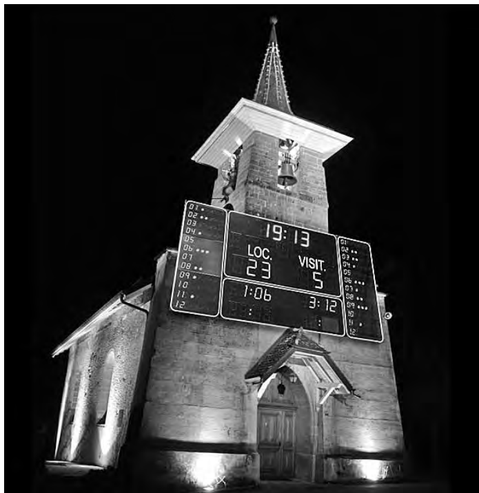
Il faut prier afin d'obtenir un esprit sain dans un corps sain. Juvénal.

J'aime bien l'image du cadeau et de l'emballage. Le cadeau est ce qui est important. L'emballage est une manière de le préparer, en vue de l'offrir. Le cadeau, c'est l'évangile, la bonne nouvelle. Cette bonne nouvelle, c'est l'amour de Dieu, la liberté, la mort vaincue, le pardon, la joie, la guérison... autant de choses merveilleuses données à travers un homme, Jésus-Christ. Comment allons-nous emballer cette bonne nouvelle? C'est tout le défi du culte. Il doit pouvoir communiquer ce cadeau. Le culte «traditionnel» est un emballage que de moins en moins de personnes apprécient. C'est une question d'éducation et de culture.